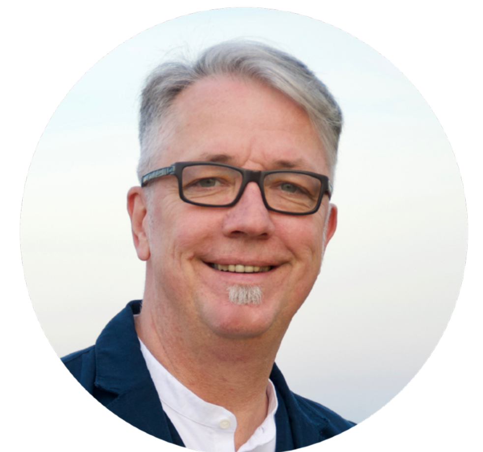
Wolf Projektleiter Köln